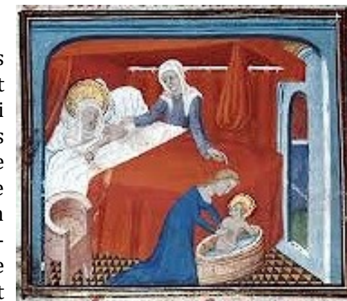
Illustration : Nativité de la Vierge, enluminure du XV ème siècle. dans l'ouvrage "Roman de Dieu et de sa mère", source : Institut de recherche et d'histoire des textes - CNRS.

elle inaugure l'économie du salut et l'inscription du Verbe de Dieu dans l'histoire des hommes.