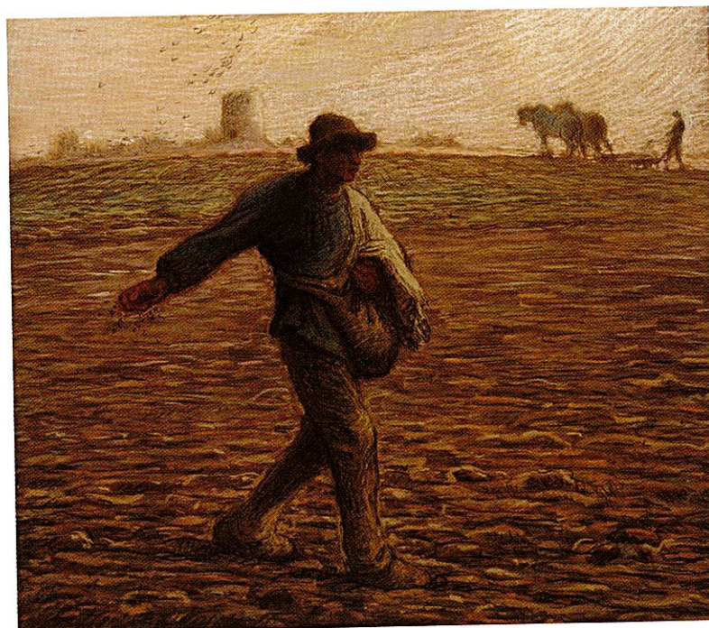
Le Semeur, Jean-François Millet, Clark Art Institute, Williamstown, États-Unis.

Comme nous Jésus a pleuré la mort de son ami. Mais il apprend à ses disciples à regarder au-delà de la mort. Il les entraîne avec lui dans sa Pâque : la mort est un passage vers la plénitude de la vie, et pour celui qui croit la vie éternelle est déjà commencée.