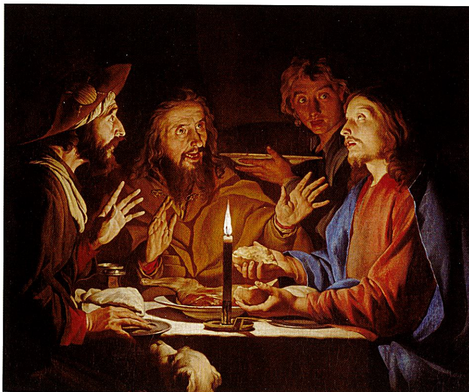
Les disciples d'Emmaüs. Mathias Stomer. Grenoble, musée des Beaux-Arts.